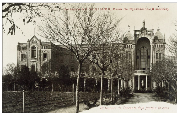
Figura 1. Tarjeta postal del edificio de la casa de ejercicios espirituales perteneciente a la Orden de los Jesuitas hasta 1932 en la localidad de Alacuás (Valencia)