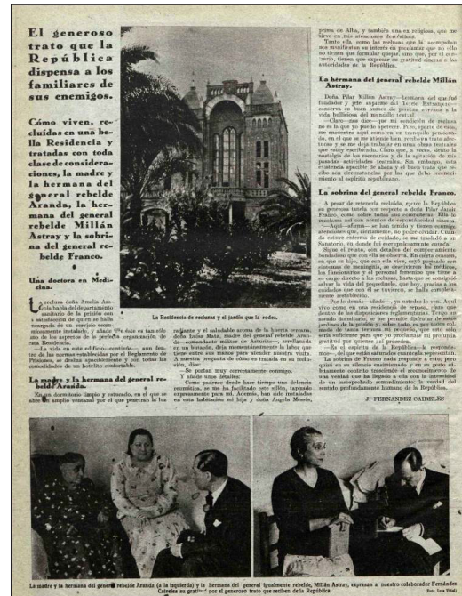
Figuras 3 y 4. Artículo de la Revista “Crónica” Nº 421 y Nº 424 de finales del año 1937 sobre trato humano a los prisioneros y prisioneras franquistas

El generoso trato que la República dispensa a los familiares de sus enemigos. Cómo viven, reclusos en una bella Residencia y tratadas con toda clase de consideraciones, la madre y la hermana del general rebelde Aranda, la hermana del general rebelde Millán Astray y la sobrina del general rebelde Franco.