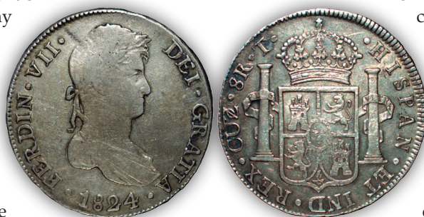
Figura 2. Cuzco. 8 reales realistas. 1824. Ensayador "T" (Tomás Panizo y Talamantes).

Medina, en su obra, muestra la pieza de dos reales que presenta marca de Ceca de Lima, con letras muy toscas y con falta de puntos, sobre todo entre las palabras de la leyenda del reverso. Esta, muestra la marca de ceca "M" con una "L" invertida haciendo la vez de primera pata de