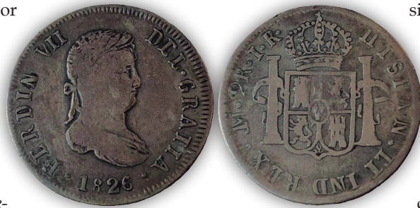
Figura 5. Lima. 2 reales de 1826. Ensayador "I·R", según Medina y Burzio, supuestamente moneda monárquica acuñada en El Callao.

Como ya se habló anteriormente, el General Rodil, quizás dispuso de maquinaria para acuñar, pero encontrarse tanto tiempo