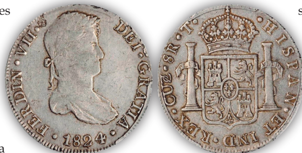
Figura 1. Cuzco. 8 reales realistas. 1824/3. Ensayador “T” (Tomás Panizo y Talamantes).

Tras unos meses de traslado pasando por las localidades de Huancayo y Huamanga, la ceca quedó instalada a finales de diciembre de 1823 en la nueva capital realista; Cuzco, y la Casa de la Moneda provisional quedó ubicada en el Convento y Hospital de San Juan de Dios.