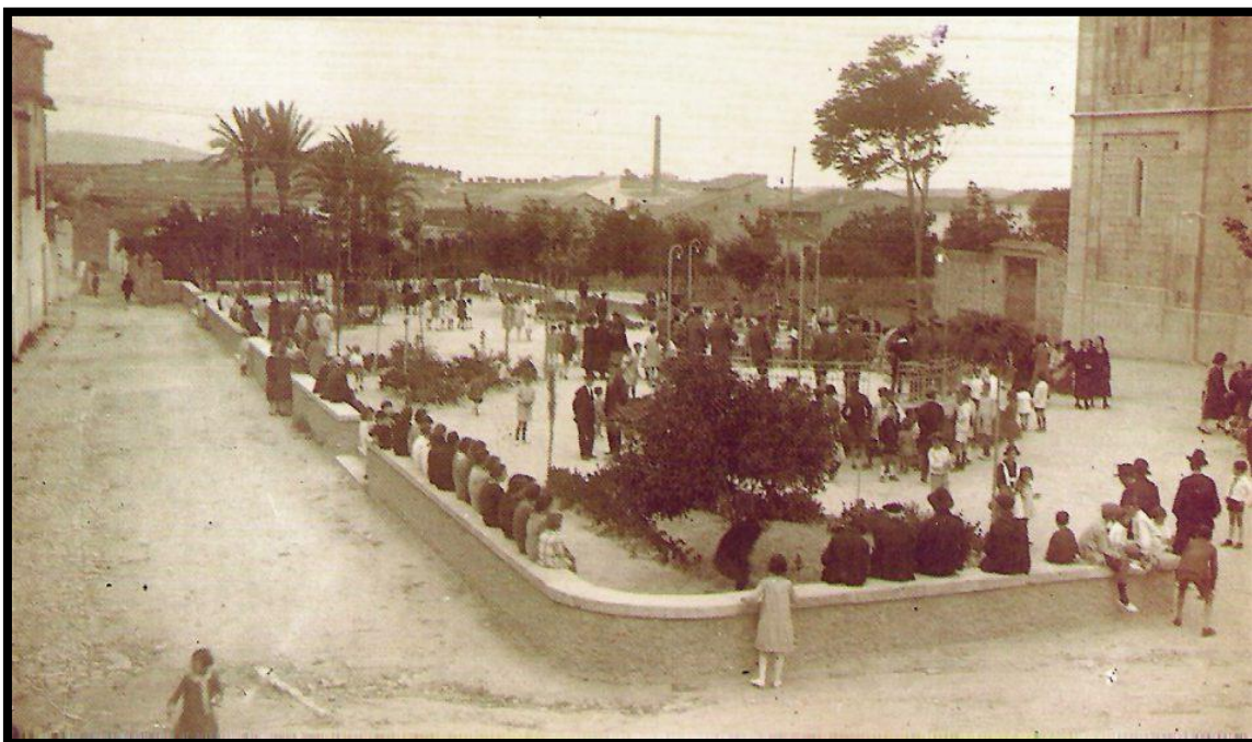
Imagen de Benissa a principios del Siglo XX.

Que se remite desde Benissa lo atestigua la marca "Cartería de Benisa", pero al ser una tarjeta postal, del remitente no se conocen datos. Va dirigida a Valencia y está fechada - no por el matasellos que no tenía fecha -, por quien la escribe en Benisa 20.07.1905 (3). Va dirigida a la calle del Pie de la Cruz 14-2º, calle existente todavía hoy en la ciudad de Valencia, calle que debe su nombre a que a ella asomaba desde el Siglo XVI el convento de las monjas Servitas de Ntra. Sra. al Pie de la Cruz (1597), demolido en el año 1940. Anteriormente se le llegó a conocer como Calle del "Molino de Na Rovella" y Calle de la "Bota Grossa".