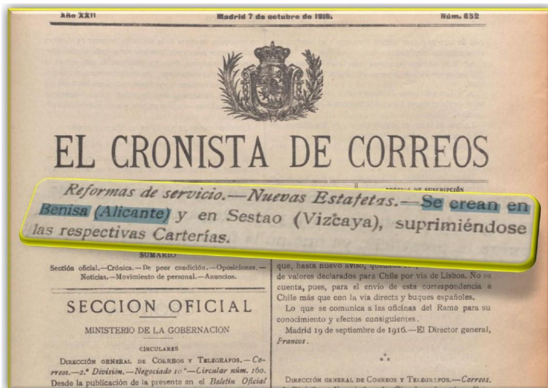
Detalle de la publicación en la revista "El Cronista de Correos" de 07.10.1916, de la creación de la Estafeta de Correos de Benisa