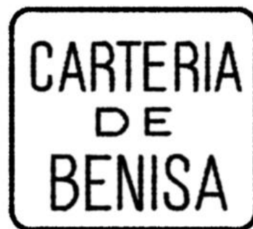
Detalle de la marca de Cartería de "Benisa", mejor estampada donde se aprecia mejor su formato

El usar tarjetas postales para escribir a la familia, frente a la carta convencional, tiene como es lógico una razón de peso: resultaba más barato para el remitente. En el año 1905, se continuaba usando la tarifa para tarjetas postales enviadas dentro del territorio nacional de 0,10 Ptas. (4) , frente a las 0,15 Ptas., que costaba el envío de una carta convencional para el mismo destino. De ahí que la tarjeta postal lleve el sello de la Serie Básica de la época, "Alfonso XIII. Tipo Cadete", de 0,10 Ptas., color rojo (Edifil 243).