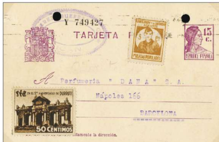
Figura 3. Tarjeta Entero Postal del tipo “Matrona”, circulada entre Alicante y Barcelona, con una de estas “viñetas” de la Junta Provincial de Socorros de Alicante. Rodillo estampado muy ligeramente

Existe otra de estas viñetas, de la que se conocen pocos ejemplares, que con un diseño totalmente distinto al anterior, pero también llevado a cabo por la Junta Provincial de Socorros de Alicante , se usaría en la documentación oficial – no se han visto ejemplares usados en la correspondencia -. En el caso que presento acompañando a estas líneas, se trata de un Salvoconducto para poder desplazarse entre Alicante y Benimantell – en el documento está mal redactado -, de fecha 08.11.1936, donde se ha añadido una de estas viñetas, de forma cuadrada, también destinada a benefi-