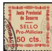
Figura 6a. Viñeta de 0,50 ptas. de la Junta Provincial de Socorros de Alicante, a beneficio de la Milicias Populares