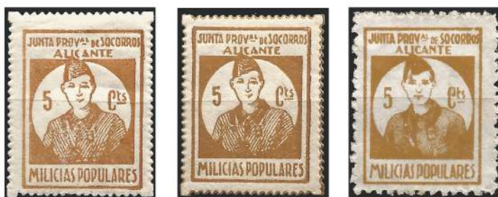
Figura 1. Tres “Viñetas” de las emitidas en Alicante por la Junta Provincial de Socorros en beneficio de las Milicias Populares, con diferentes tipos de dentados

Por lo tanto cada provincia se ocuparía de recaudar y administrar ese dinero aportado por la población, en ayuda de los más necesitados del momento, la mayoría de ellos combatientes y familiares. Y dentro de esas aportaciones, muchas de estas Juntas Provinciales de Socorros, optaron por la creación de “sellos” – sin poder de franqueo –, que se usaría en la