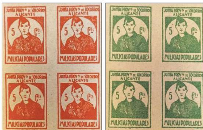
Figura 2. Dos Bloques de 4 sellos “Sin Dentar”, donde se aprecia una diferencia sustancial de color e incluso con alguna imperfección en alguno de los ejemplares