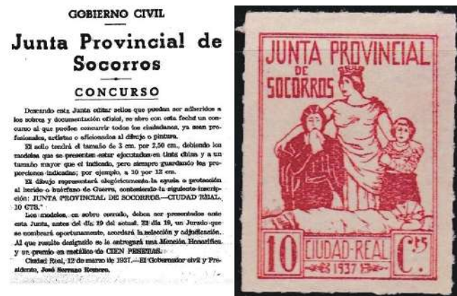
Figura 5. Concurso de la Junta Provincial de Socorros de Ciudad Real, con los detalles que ha de reunir el sello (C. Real 12.03.1937). Al lado, el diseño de la viñeta que resultó ganadora y que se emitió para su uso