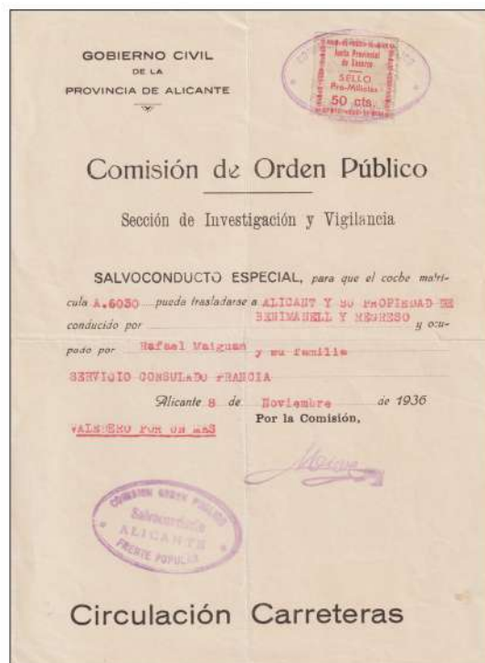
Figura 6. Salvoconducto emitido en Alicante, con viñeta añadida de la Junta Provincial de Socorros, con un valor facial de 0,50 ptas.

6. Se trató de aquellos conjuntos de voluntarios que pertenecientes a diversas organizaciones, se alistaron para combatir, sin pertenecer al ejército.