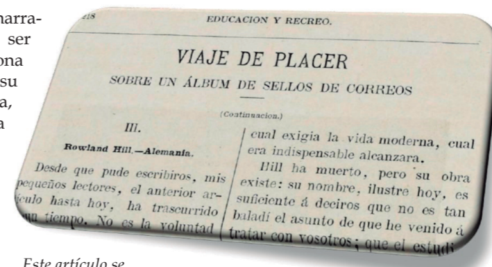
Este artículo se publicó durante meses en la revista La Niñez, en forma de entregas, y fue dando a conocer aspectos del coleccionismo de sellos, según los conocimientos de la época.

Este relato prosigue en números de la revista posteriores (5) , en forma de entregas. Así tenemos que en la 2ª parte hablan entre ellos de la importancia de la filatelia, donde ambos hablan de la historia reciente y de la que a través de los sellos se puede conocer. Incluso, el narrador le hace una confesión a Arturo al hablarle de “Sociedades de Timbrología”, diciéndole que él es “...socio fundador de la de París y corresponsal de la Nacional filatélica de Nueva-York...”, prometiéndole que en futuros días le mostrará los boletines que estas sociedades filatélicas editan, donde