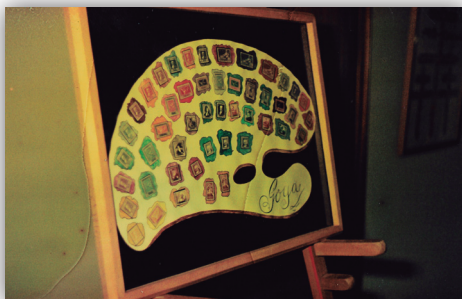
Curiosa forma de exponer los sellos de "Goya".

El poder haber recuperado todo este "foto-patrimonio" (8) filatélico, forma parte de la esencia de la filatelia. No vale pensar solo en el hoy ó el mañana. También tenemos que ser conscientes de que el ayer, aunque se ha tratado de recuperar, escribir y divulgar, todavía queda