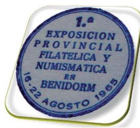
Gomígrafo utilizado en la 1ª Exposición Filatélica celebrada en Benidorm (Agosto 1965).

la fotografía. O lo que hubiera sido peor, que se perdieran para siempre y con ello perder un legado histórico-filatélico insustituible. Y ahí entró a realizar su