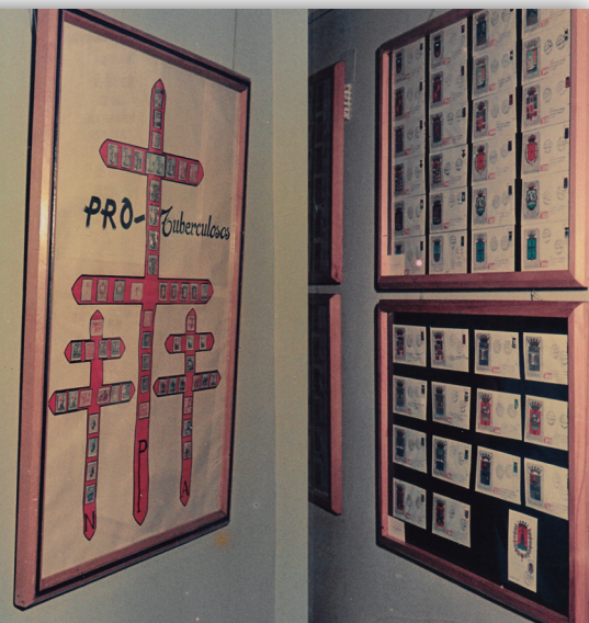
Instantánea en la que se ve como estaban montado algunos paneles, en forma de cuadros decorativos. Muy de la época.