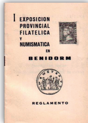
Portada del Reglamento publicado con motivo de la exposición.