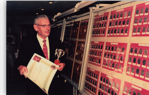
Uno de los participantes numismáticos frente a su colección de monedas y portando tanto el trofeo como el diploma.