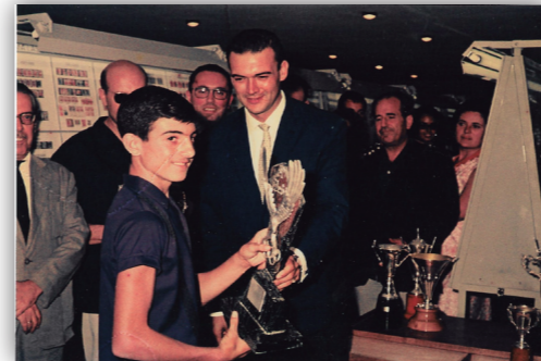
También la juventud tuvo su protagonismo en esta exposición benidormense.