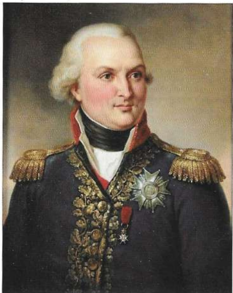
Almirante Louis Thomas Villaret de Joyeuse

L A CORRESPONDENCIA EN CARTAS COMERCIALES de los siglos XVIII y XIX, generalmente manuscrita por corresponsales, agentes comerciales, cónsules o agregados de algunos de los principales comerciantes españoles destacados en países europeos, aparte de detallar el estado de sus negocios, también relatan sucesos recientes para informar a sus superiores de posibles futuros inconvenientes en las transacciones comerciales.