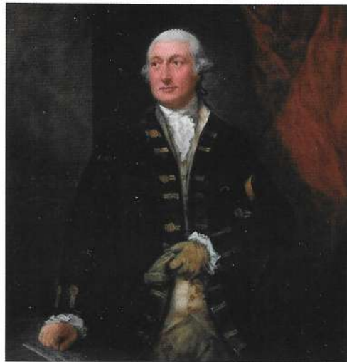
Almirante Lord Graves herido en la Batalla del Glorioso Primero de Junio

"Gazeta de Madrid", martes 15 de julio de 1794 con noticias de la batalla del 1 de junio. Nº 56. Págs. 831-833