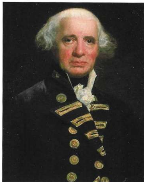
Contralmirante Sir Richard Howe

Este fue el motivo que causó la conocida batalla del 1 de Junio de 1794 (13 Prairial, Año II del calendario revolucionario) entre dos de las potencias europeas del momento, Francia y Gran Bretaña, también conocida como la “Cuarta Batalla de Ushant” o del “Glorioso