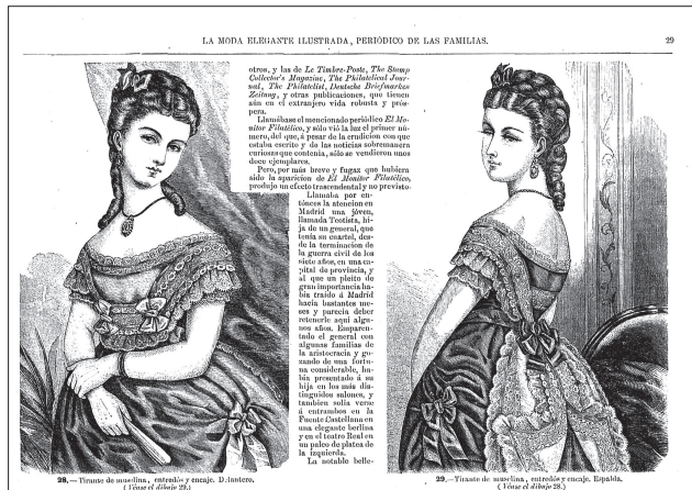
Revista " La Moda Elegante " (Cádiz). 30.01.1873. Detalle del artículo mencionando el periódico " El Monitor Filatélico "