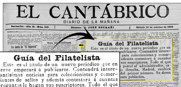
Detalle de la noticia aparecida en el periódico El Cantábrico de fecha 10.10.1896, hablando de esta inédita publicación filatélica

Hasta 1896, en España habían aparecido un total de veintiún publicaciones de ámbito filatélico, veintitrés con estas dos nuevas revistas. Algunas no durarían mucho, otras se posicionarían como referente filatélico a finales del siglo XIX. “Guía del Filatelista” se editaría en Madrid, fijando su dirección social en la calle Lagasca Nº 51 bajo derecha, y cómo arranque de la edición, a todo aquel que mediante envío de tarjeta postal dirigida al administrador – no sabemos administrador de que exactamente – recibiría un ejemplar del primer número gratuitamente.